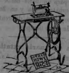
TIPO DE LA Verdadera Elias Howe

Las unicas que han obtenido siempre las mas altas recompensas en todas las exposiciones universales desde 1862